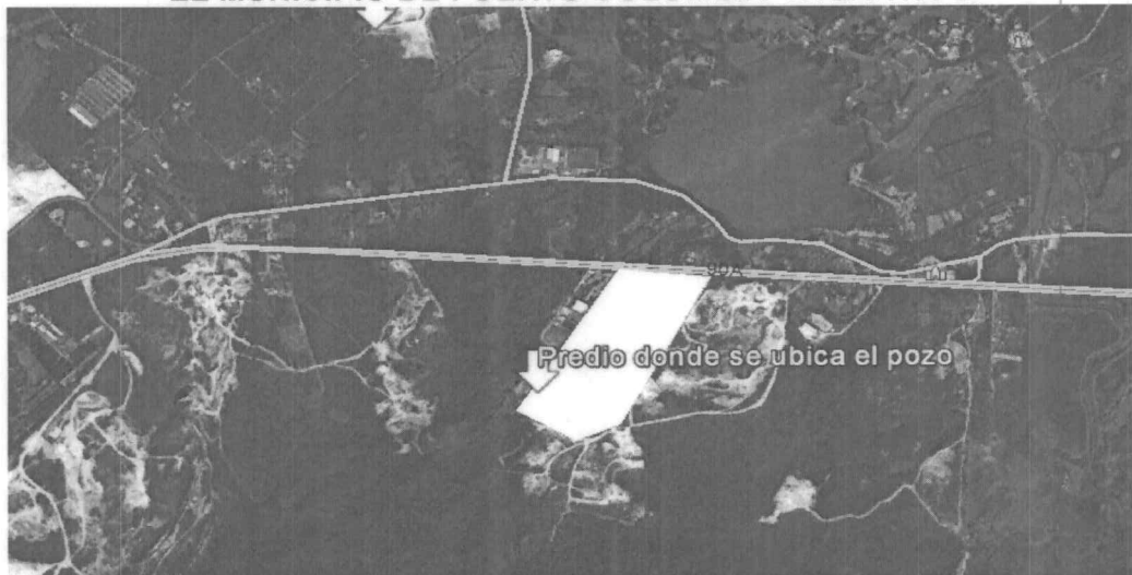
Imagen satelital. Localización del predio del Colegio Murphy.

POR MEDIO DEL CUAL SE HACEN UNOS REQUERIMIENTOS AL COLEGIO MURPHY EN EL MUNICIPIO DE PUERTO COLOMBIA- ATLANTICO.